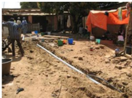
Pose d'une canalisation au Mali

- Comment les besoins sont-ils couverts actuellement ? : Si le village ou le quartier possède déjà son propre système d'assainissement, probablement insuffisant et perfectible, il est important d'analyser soigneusement ce qui existe déjà et quelles en sont les lacunes, mais aussi ce qui peut être éventuellement conservé ou seulement adapté..