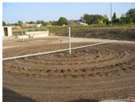
2) Massif filtrant de la station de Mazens