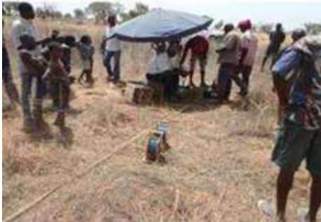
Recherche de nappe par étude géophysique à Namou Kounlogue au Togo

Les enquêtes préalables sur le terrain et la méthode des sourciers fournissent déjà des indications intéressantes et à moindre coût lorsqu'on ne dispose que de faibles moyens..