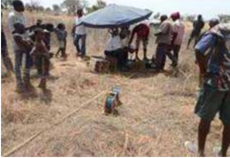
Recherche de nappe par étude géophysique à Namou

Les enquêtes préalables sur le terrain et la méthode des sourciers fournissent déjà des indications intéressantes et à moindre coût lorsqu'on ne dispose que de faibles moyens..