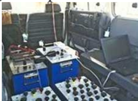
Appareillage RMP

Au Tchad , plus de 300 000 réfugiés des pays voisins se sont installés ces dernières années dans l'Est où le manque d'eau est déjà important.