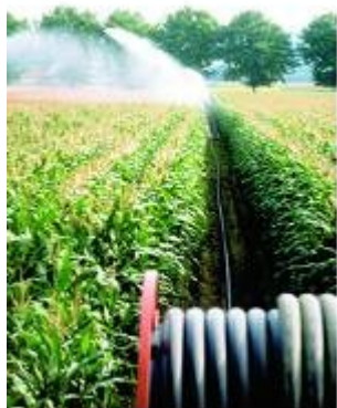
Irrigation par aspersion

Cette méthode très répandue dans certaines régions nécessite, du fait de pertes dans le sol, beaucoup d'eau et des aménagements importants de terrain mais permet d'irriguer facilement de grandes surfaces.