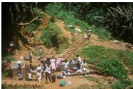
Captación desde un manantial en Camerún

Es aplicable si el manantial emerge fácilmente por sí solo con un caudal suficiente . En general, el proceso comprende 5 etapas :