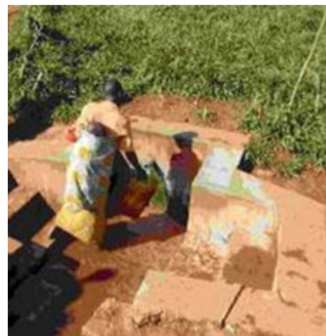
Captación y acondicionamiento de un manantial en Burundi (esquema y fotografías : Cáritas)