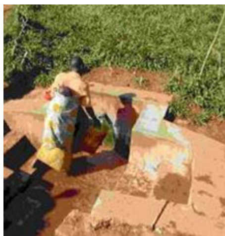
Captación y acondicionamiento de un manantial en Burundi (esquema y fotografías : Cáritas)