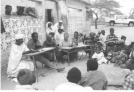
Sesión de formación y de intercambio en Níger.