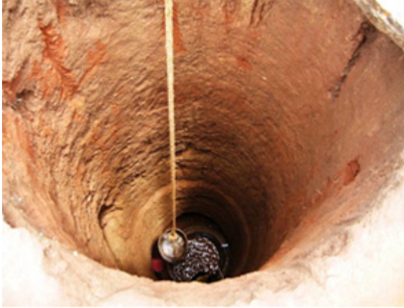
Excavación manual de un pozo en Madagascar.

realizado mediante la colocación de las herramientas en el suelo, o la de una perforación, cuyo orificio es, por el contrario, estrecho, habida cuenta de las herramientas empleadas y de la gran profundidad que debe alcanzarse.