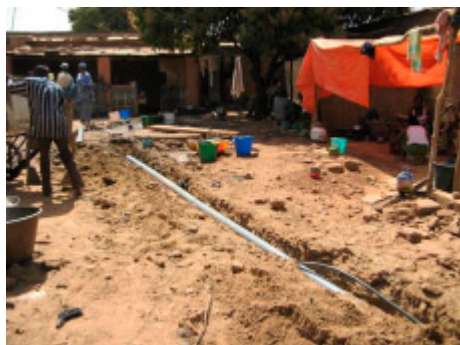
Construcción de una red en Bamako

Este procedimiento constituye la infraestructura más eficiente para la evacuación de aguas residuales. Puesta por obra de manera generalizada en los países desarrollados, se usa en ciertas zonas urbanas de países en desarrollo que suelen estar equipados ya con una red de distribución de agua potable. Se realiza mediante tuberías cuyo diámetro es más o menos grande, para distancias a veces muy largas, según los caudales de efluentes que deban transitar. Esto permite transportar por gravedad, o de ser necesario con bombas, el conjunto de las aguas residuales de los habitantes así como las aguas pluviales. Las infraestructuras necesarias son importantes y costosas. Además, las redes de alcantarillado urbanas deben conectarse a una estación de tratamiento antes de su vertido en la naturaleza.