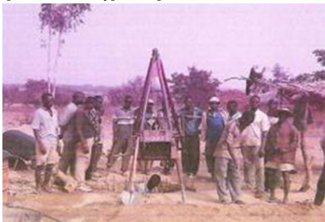
Creusement d'un puits région des Savanes au TOGO

Les puits creusés ne sont pas très profonds ( entre 10 et 20 m le plus souvent , exceptionnellement 30 à 40m). Etant peu profonds, ils risquent d'être contaminés et ils peuvent s'assécher plus facilement que les autres types de puits.