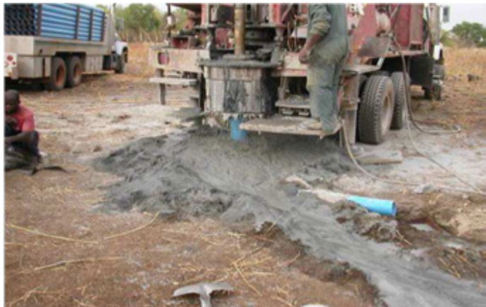
Forage d'un puits au TOGO

assez souvent le cas au début d'un forage,, des grandes vrilles appelées tarières . Les forages peuvent atteindre plusieurs centaines de mètres de profondeur. Souvent, une pompe est placée au bas pour pomper l'eau jusqu'à la surface.