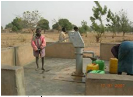
Puits foré au BURKINA FASO