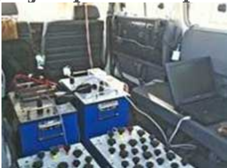
Instrumentos de RMP

Durante los últimos años, más de 300.000 refugiados procedentes de los países vecinos se han instalado en la parte oriental del Chad , donde la falta de agua es ya importante.