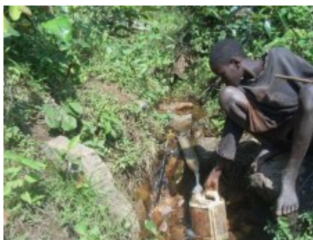
Manantial antes del acondicionamiento ❌