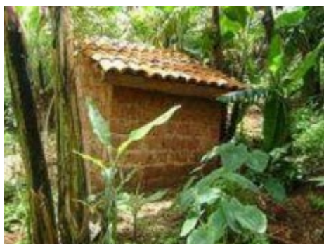
Letrina familiar construida en una zona alejada ❌

De forma paralela, habida cuenta de su importante programa de construcción de letrinas y de sensibilización sobre higiene y salud, la ODAG creó " clubes mixtos de higiene " en las escuelas primarias formados por unas diez personas (alumnos, docentes y padres de alumnos).