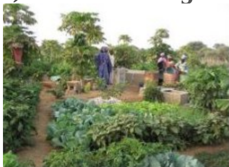
Creación de cultivos frutales en Mali.