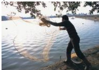
Lanzamiento de una pequeña actividad pesquera

Al vencer el préstamo, el internauta puede elegir el reembolso de su dinero o su reinversión en otro proyecto.