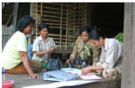
Banco de ahorro comunitario en Camboya 🗨

Este enfoque es complementario del anterior debido a la baja densidad de las redes de crédito bancario, pero también por constituir un medio para que los solicitantes traten con interlocutores del mismo estatus sociocultural, socioeconómico o socioprofesional. De este modo, las condiciones de los préstamos concedidos pueden resultar más adaptadas para los prestatarios que las de las instituciones bancarias.