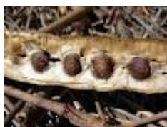
Graines de moringa . Photo Banque Pdf