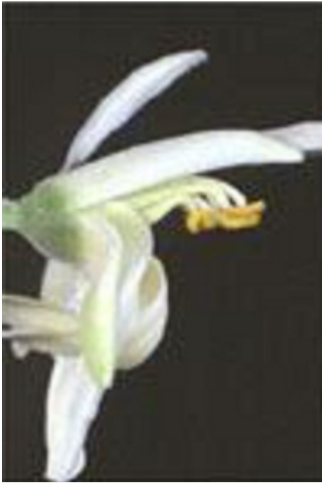
Fleur de moringa

Il est intéressant dans le cas de populations de plus de 1 000 personnes et réalisé alors dans des installations spécifiques,