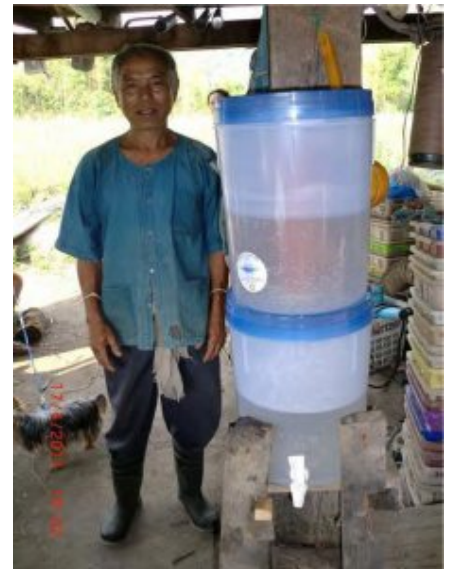
Filtre « Bushproof » à Madagascar