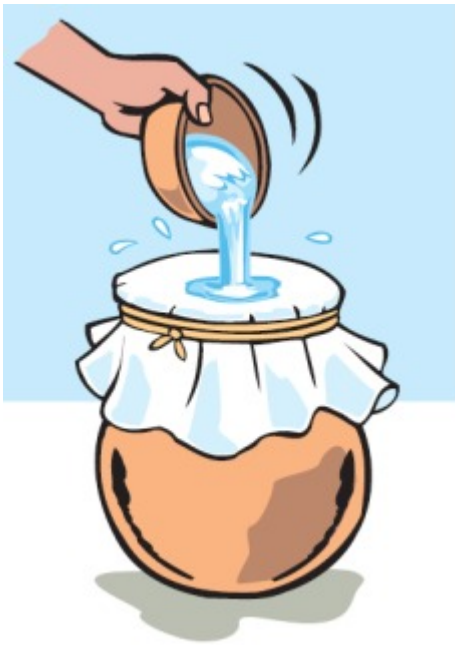
Illustration Croix Rouge