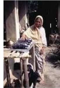
Exposition de bouteilles au soleil dans un caisson réfléchissant