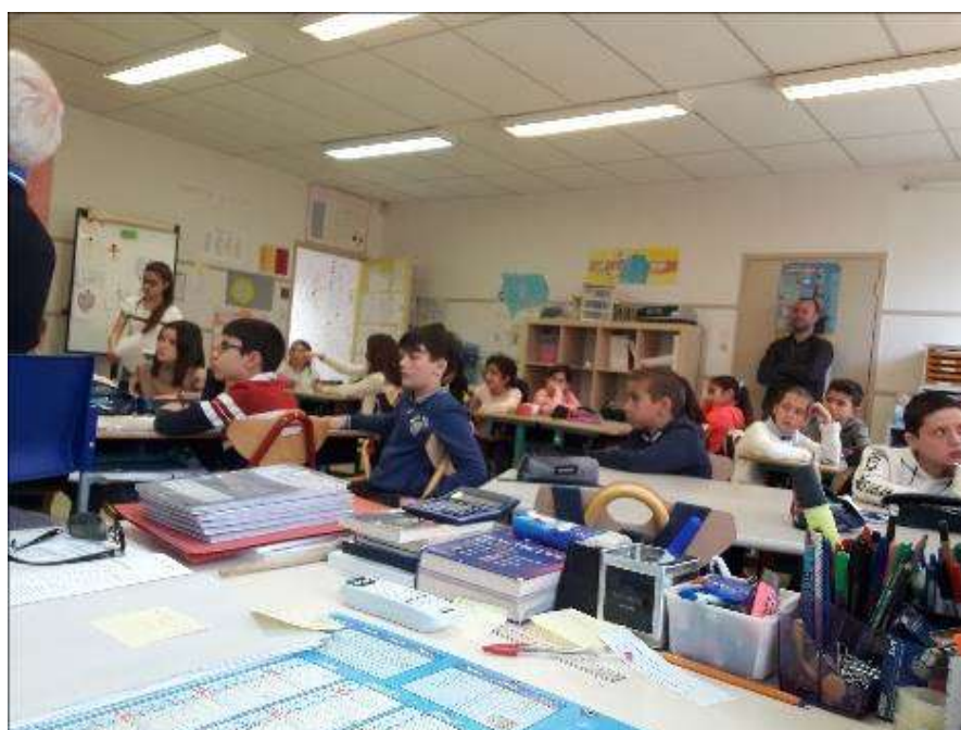
« Classe de CM2 de l'école de St Witz »

En 2019 les élèves de l'école primaire de Saint Witz (Val d'Oise près de Roissy) avaient fabriqué deux prototypes de pompe à eau à corde et à pistons en caoutchouc, pompes très efficaces et coûtant moins de 100 €.